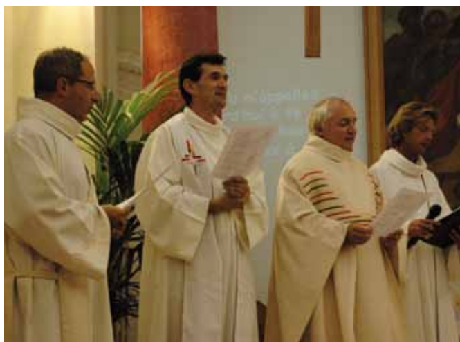
La cérémonie célébrée par le vicaire général Jean-Marc Aveline

la vie chrétienne par les enfants à l'Œuvre, n'est pas de l'ordre du discours mais essentiellement du vécu. « Ici on joue, ici on prie », disait-il. Il y a aussi l'idée de la confiance en Dieu. Pas un optimisme béat face aux