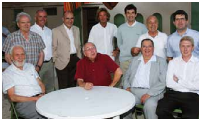
La communauté des Messieurs au complet.

La vie de groupe pendant les camps m'a beaucoup apporté. Pendant sept ans, j'ai été animateur essentiellement dans le groupe JKD, puis j'ai pris un peu de dis-