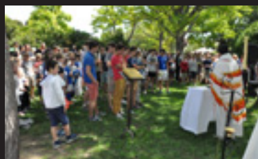
Journée Familiale / Famiho 6/7