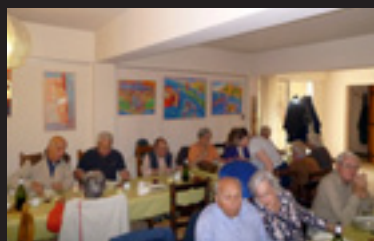
Sortie des anciens 5