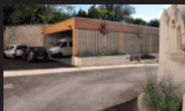
Les travaux aux IRIS 3/4